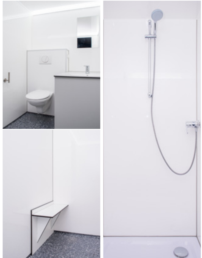
INNENANSICHT :: INTERIOR VIEW