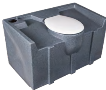
GLOBAL 320L Einbautank groß