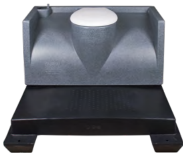
GLOBAL 250L Standardeinbautank