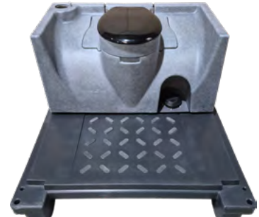
GLOBAL REZI F Rezirkulationstank mit Fußpumpe