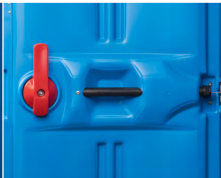
NEUE TÜR breiter, höher und stabiler