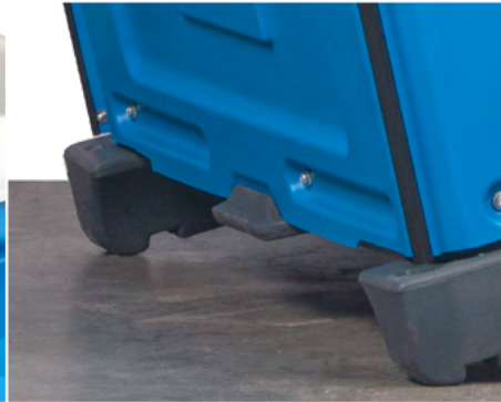
FUSSTRITT zum einfacheren Ankippen