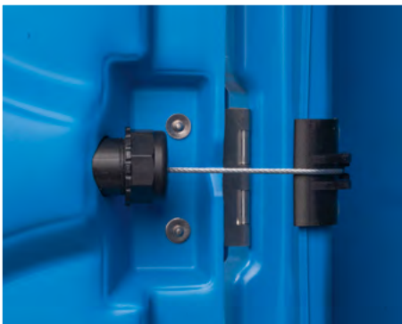
SCHLIESSMECHANISMUS neu konzipiert und einstellbar