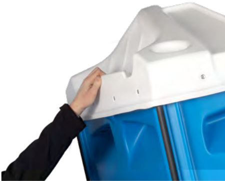
TRANSPORTGRIFF zum leichteren Handling