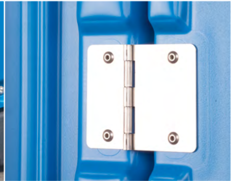
BELASTBARE SCHARNIERE jetzt leichter zu montieren und haltbarer